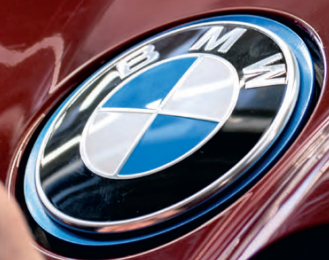
Abbildung zeigt Sonderausstattungen.