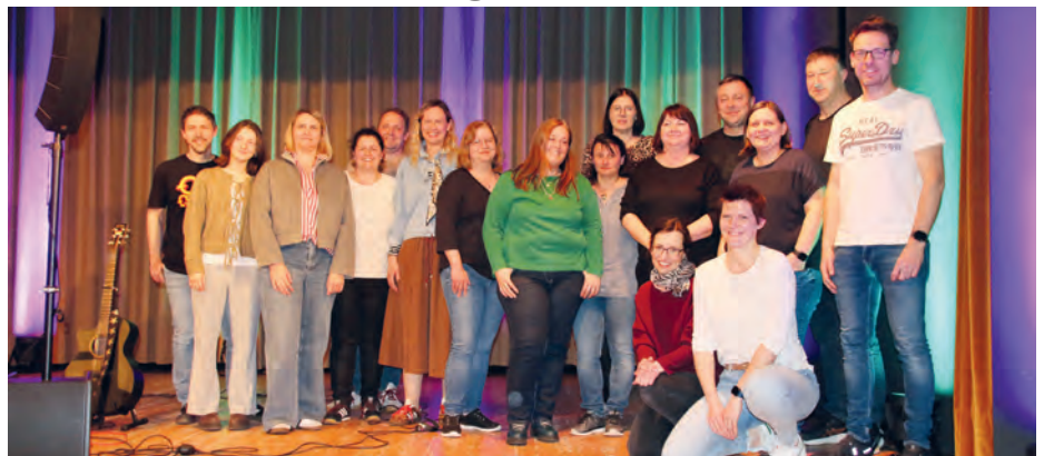
Die Glücklichen Gewinner des Quiz-Abend waren von Platz 1 bis 3 die Teams „Sand in der Ritze“, „Quiztopher Kolumbus“, und „die Aperolos“.

Hatten bei den letzten Quiz-Abenden mehrmals auswärtige Teams aus Kemnath oder