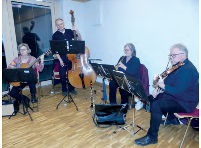
Die "Schleifband" mit örtlichen Musikgrößen sorgte für den musikalischen Rahmen

Zu einer Gala wurde die 10-Jahr-Feier der Gesellschaft Hand in Hand (GeHiH). Der Pfarrsaal wurde zu einem Ort des gemeinsamen Feierns und Austauschs. Nach einem Jahrzehnt praktizierter Nächstenliebe war es das Ziel, Sichtbarkeit und Bekanntheit eines Anliegens zu steigern.