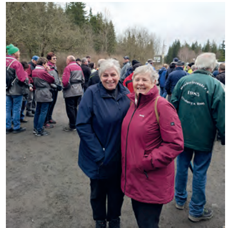
Geführte Wanderung in Bischhofsgrün

Die nächste Monatsversammlung findet am Mittwoch, den 08.04.2026 um 19:00 Uhr im Hotel/Pension Rattunde statt.