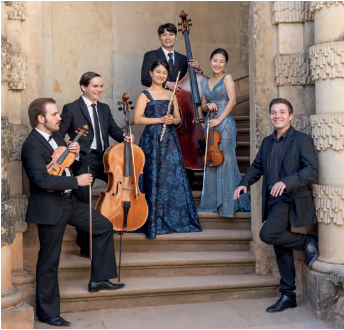
Das Dresdner Residenz-Orchester eröffnet das Altstadtfest mit dem unvergesslichen Konzertabend „Klassik in der Altstadt“. Karten sind im Vorverkauf erhältlich.