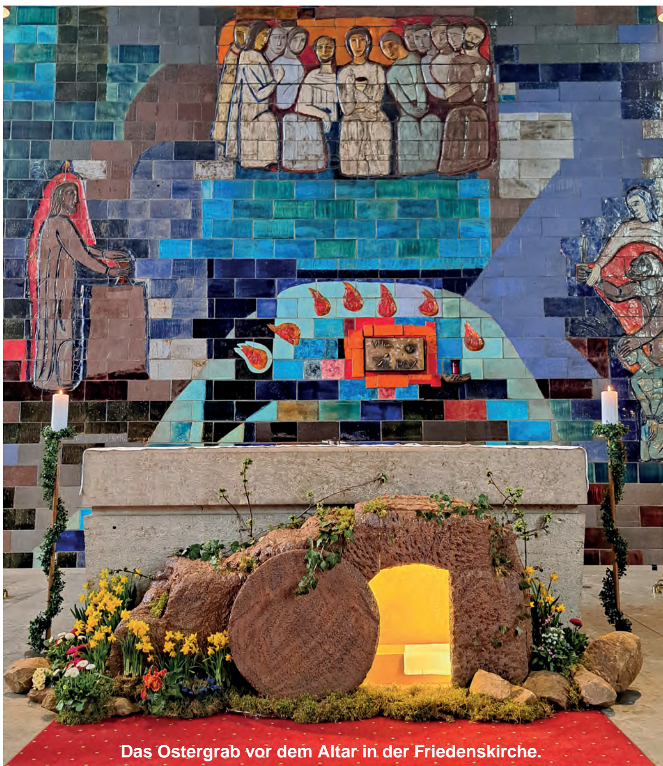
Das Ostergrab vor dem Altar in der Friedenskirche.