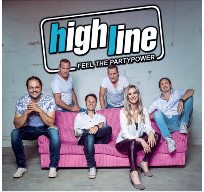
Wie vor zwei Jahren beim Nordgautag wird die Partyband Highline auch beim Altstadtfest am 09. Mai den Stadtpark rocken.

Gleich zwei Gründe zum Feiern hat Grafenwöhr diesen Mai, deshalb geht es am 08. Mai und 09. Mai zwei Tage lang rund in der Altstadt und im Stadtpark.